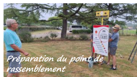
Préparation du point de rassemblement

Ce sont ainsi cinquante personnes mobilisées pour l'accueil des congressistes à l'Agora à Agen, puis à Moirax. Chacun était doté d'un badge conçu par le Comité Local et imprimé par le Conseil Départemental.