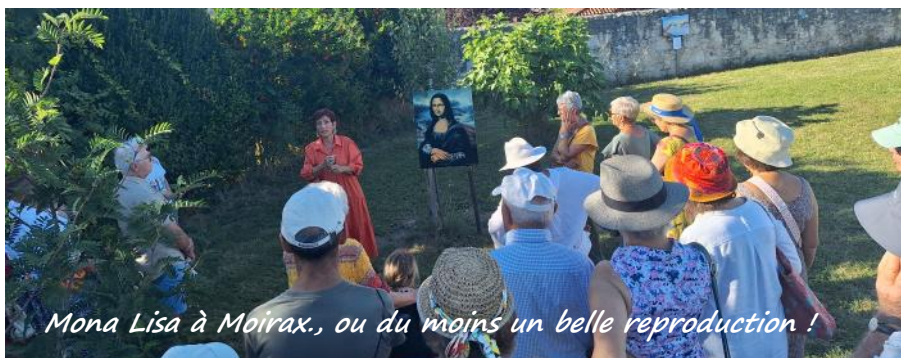
Mona Lisa à Moirax., ou du moins un belle reproduction !