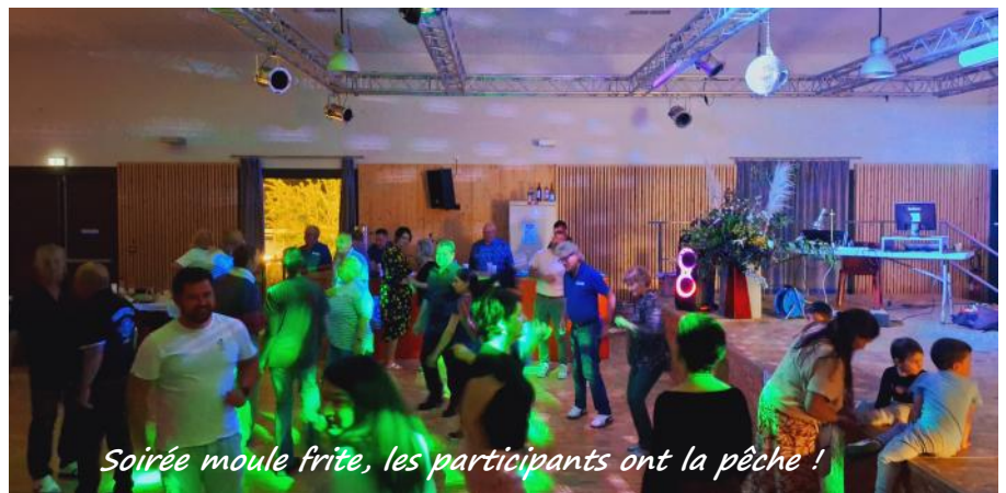
Soirée moule frite, les participants ont la pêche !

bure à la mode béarnaise. Un régal pour les participants. Comme d'habitude, à Fêtes et Loisirs, un repas se termine en