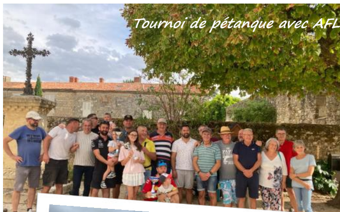
Tournoi de pétanque avec AFL