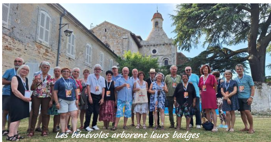
Les bénévoles arborent leurs badges

Les vingt membres du comité local pour la candidature UNESCO n'ont pas ménagé leurs efforts pour préparer l'accueil de la Fédération Européenne des Sites Clunisiens à Moirax qui s'est tenue le 4 juillet dernier.