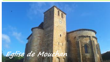
Eglise de Mouchan

Dimanche 24 mai, une dizaine de moiracais, dont le maire et son épouse, avaient fait le déplacement à Mouchan, site clunisien de Gers.