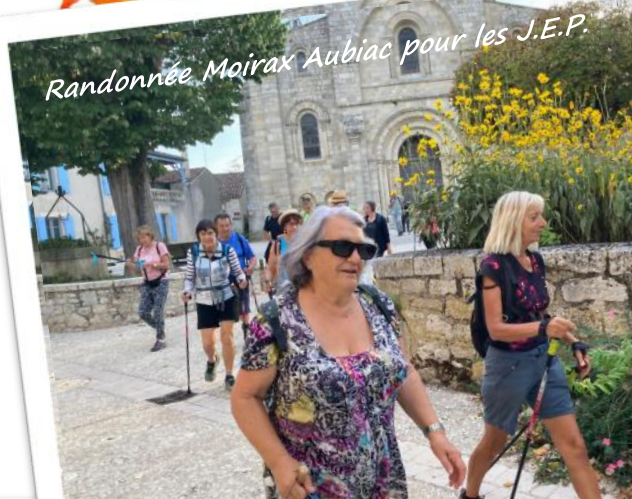
Randonnée Moirax Aubiac pour les J.E.P.