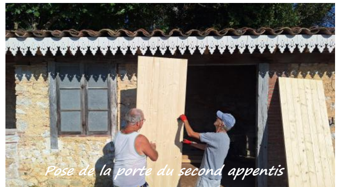
Pose de la porte du second appentis

Les appentis, situés dans le parc du Prieuré, continuent à être restaurés. Au cours du chantier d'été