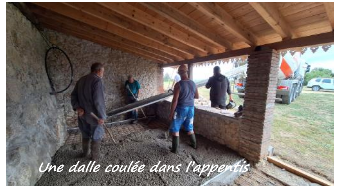
Une dalle coulée dans l'appentis

Les férus de maçonnerie ont pu donner libre cours à