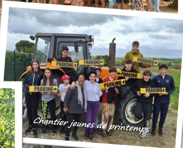
Chantier jeunes de printemps