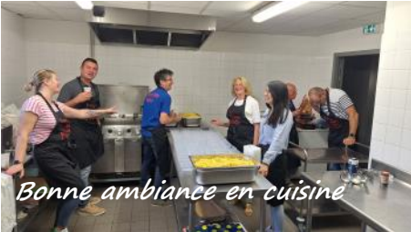
Bonne ambiance en cuisine

Papilles et sens de la fête, voilà l'ADN de l'Association Fêtes et Loisirs, au fil des années.