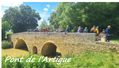
Pont de l'Artigue

Dimanche 24 mai, une dizaine de moiracais, dont le maire et son épouse, avaient fait le déplacement à Mouchan, site clunisien de Gers.