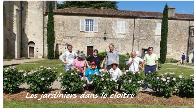
Les jardiniers dans le cloître

En avril, les volets de la salle des moines ont été démontés, poncés et repeints. En mai, le jardin du