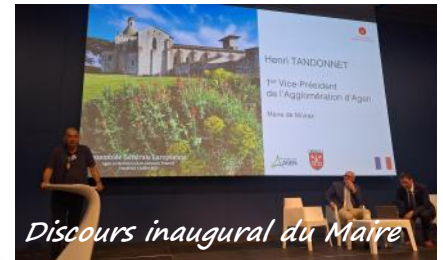
Discours inaugural du Maire