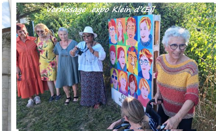
Vernissage expo Klein d'Œil