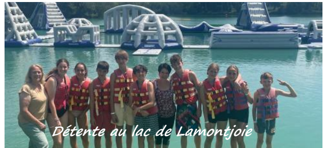
Détente au lac de Lamontjoie