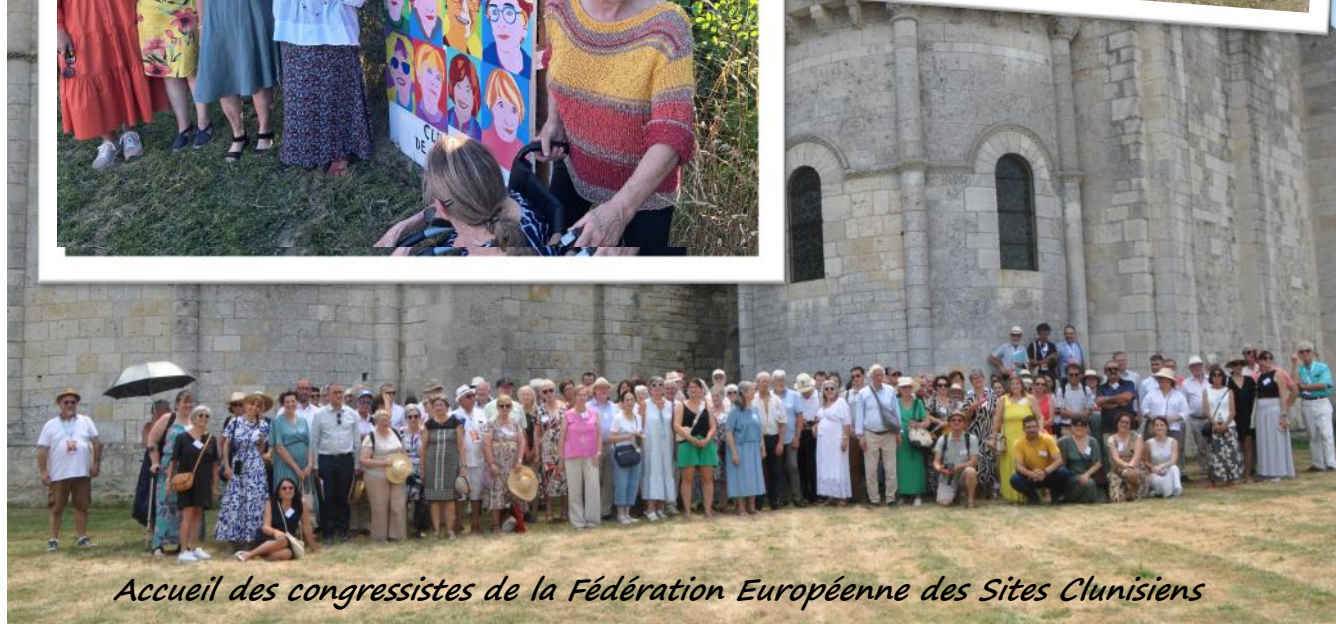
Accueil des congressistes de la Fédération Européenne des Sites Clunisiens