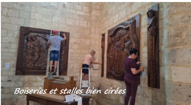
Boiseries et stalles bien cirées