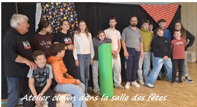
Atelier clown dans la salle des fêtes

parkings ont été réalisés en vue de l'AG Cluny. Les activités récréatives ont été variées : sortie Karting à Caudecoste, atelier chocolat animé par Na-