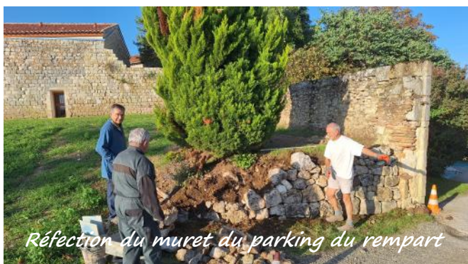
Réfection du muret du parking du rempart