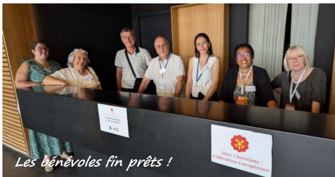
Les bénévoles fin prêts !

Plus d'une dizaine de bénévoles ont aidé le bureau de la Fédération et Destination Agen à assurer, dès le 3 juillet, l'installation puis le jour J, l'accueil à l'Agora d'Agen des 180 adhérents de la