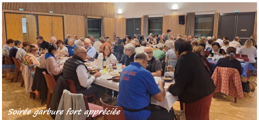
Soirée garbure fort appréciée

D'autres animations sont annoncées, un repas d'automne le 22 novembre et la visite du père Noël et son vin chaud à la sortie de la messe de Noël !