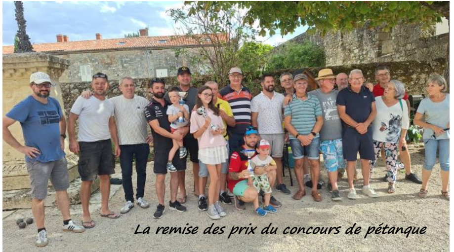
La remise des prix du concours de pétanque

Le 7 septembre, la seconde édition du tournoi de pétanque a tenu toutes ses promesses. La place de l'église s'est transformée pour une journée en une