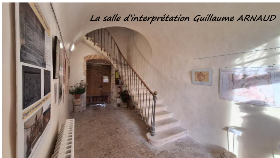
La salle d'interprétation Guillaume ARNAUD